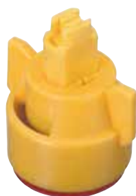
РАСПЫЛИТЕЛЬ AIXR И КОЛПАЧОК