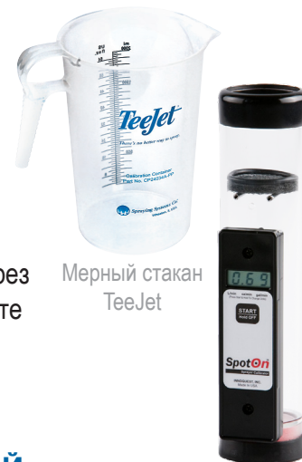
Мерный стакан TeeJet

Проводить на чистой воде, желательно на ровной площадке с покрытием. Включите опрыскиватель и задайте давление, соответствующее вашему типу и размеру распылителей, норме вылива и скорости. При помощи секундомера и мерной кружки или электронного калибратора, произведите замеры фактической пропускной способности через одну форсунку: выборочно, посекционно, либо полностью всю штангу. Результаты занесите в таблицу. Выявить поврежденные распылители быстро поможет раздел «Калибровка» в мобильном приложении TeeJet «SpraySelect», где вы можете воспользоваться таймером, ввести результаты замера и получить информацию о кондиции форсунок.