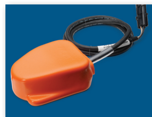
ОПЦИЯ ПЕДАЛЬ (МОЖНО ЗАКАЗАТЬ ОТДЕЛЬНО)