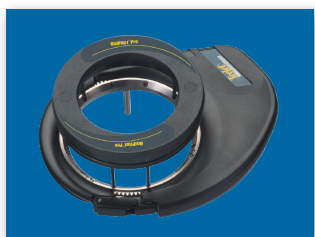
ЭЛЕКТРИЧЕСКОЕ ПОДРУЛИВАЮЩЕЕ УСТРОЙСТВО

Узнайте больше о UniPilot Pro и навигаторе Matrix на сайте www.teejet.com