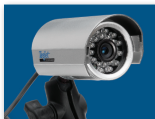
ПОДДЕРЖИВАЕТСЯ ДО 8 КАМЕР