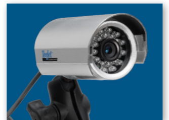
GALIMYBĖ PAJUNGTI IKI 8 KAMERŲ