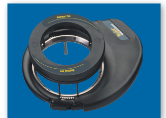
ELEKTRINIS VAIRAVIMO ĮRENGINYS

Sužinokite daugiau apie UniPilot Pro ir MATRIX navigacijos sistemas, aplankykite www.teejet.com