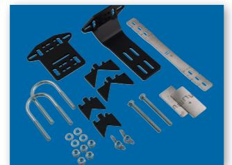
UNIVERSALUS MONTAVIMO KOMPLEKTAS