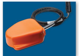
KOJOS PEDALAS PERJUNGIMUI