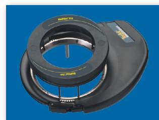
ELEKTRILINE AUTOMAATROOLIMISE SEADE

Loe rohkem UniPilot Pro ja Matrix-i paralleelsõiduseadmetest www.teejet.com