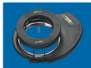
MOTOR ELÉCTRICO PARA EL VOLANTE

Obtenga más información acerca de UniPilot Pro y el GPS Matrix, visite www.teejet.com