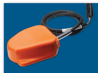
ПЕДАЛЬ (ВЖЕ В КОМПЛЕКТІ ПОСТАЧАННЯ)