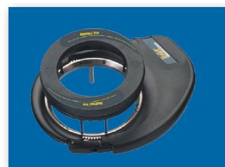
ЕЛЕКТРИЧНИЙ ПІДРУЛЮЮЧИЙ ПРИСТРІЙ

Дізнайтеся більше про UniPilot Pro і навігатори Matrix на сайті visit www.teejet.com