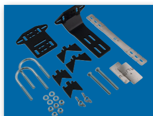
УНІВЕРСАЛЬНИЙ МОНТАЖНИЙ КОМПЛЕКТ