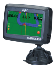
КОНСОЛЬ MATRIX 430