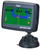
КОНСОЛЬ MATRIX 430